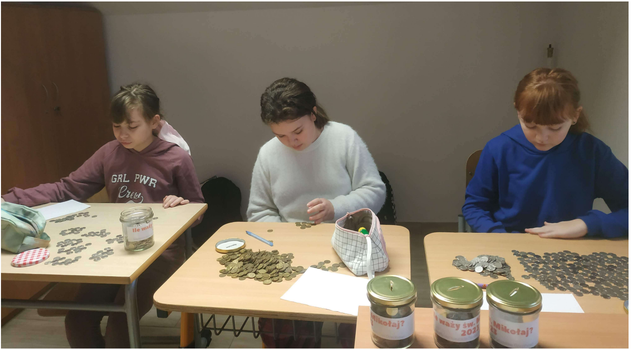
Uczennice klasy piątej zaangażowane w zliczenie zebranych bilonów